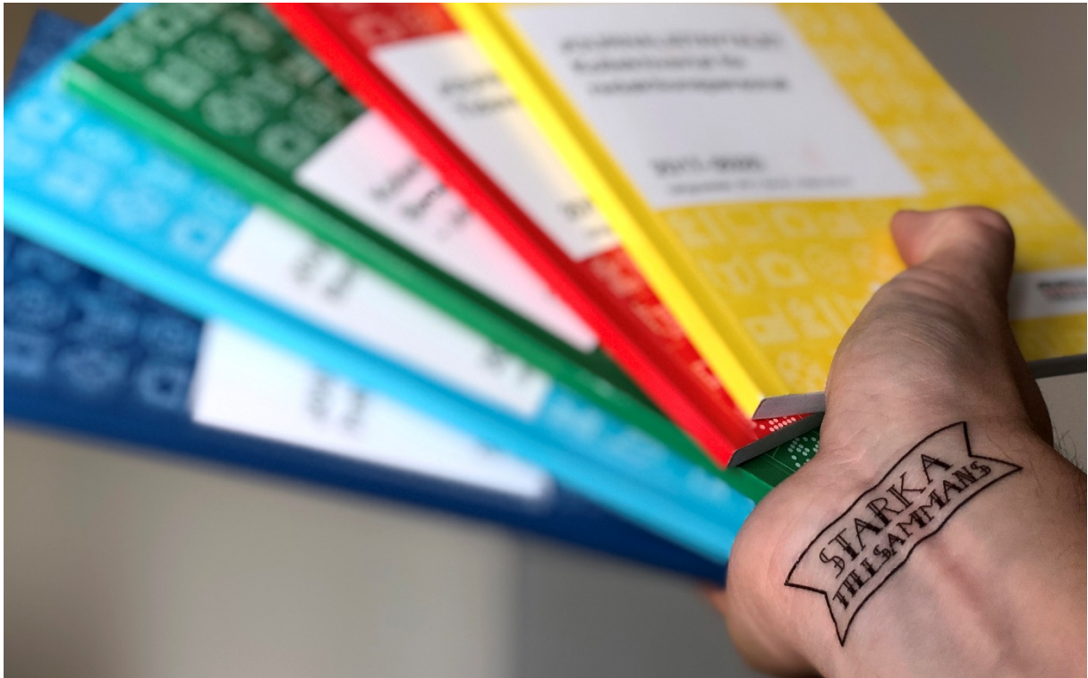
Bild på fem av förbundets kollektivavtal.

Samtliga avtal följer, som brukligt, industriavtalet i lönenivåer och avsättning till flexpension. Industriavtalet sätter alltså "märket" på svensk arbetsmarknad. Löneutrymmets storlek, i förhållande till periodiseringen av pensionsavsättningarna, var inledningsvis en tvistefråga mellan Almega och samtliga tjänstemannaförbund, men frågan löstes under förhandlingens gång. Som en del av "märket" ingick även en överenskommelse om en arbetsgrupp om organisatorisk och social arbetsmiljö, som ska genomföras på förbundsövergripande nivå.